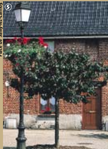
Place de Sully-les-Lannoy.

Fabriquer une brique relève d'un véritable savoir-faire. Jusqu'au XIX e siècle existaient des briquetiers ambulants, souvent d'origine belge, se déplaçant d'un chantier à