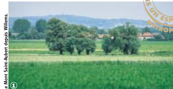
Le Mont Saint-Aubert depuis Willems.

Sur les chemins de campagne de la Pévèle, du Mélantois et de la Haute-Deûle