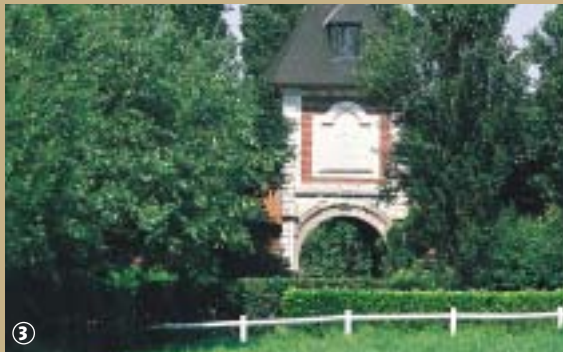
Ferme de Meurchin, Sully-les-Lannoy.

Elle participe à la ferveur régnant dans le Nord, ses couleurs vives et chatoyantes aidant. Elle est issue du mariage savant de l'argile, des limons et du sable. Elle est présente partout, sur les façades des maisons et des fermes ; en première ligne des fortifications ; vestige de l'épopée industrielle de notre département, aux avant-postes de