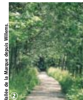
Vallée de la Marque depuis Willems.

Cette boucle s'enchaîne aisément avec la « boucle des Bonniers » pour une balade totalisant 18,5 km.