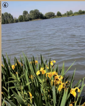
Iris des eaux. ⑥

A l'affût, il est capable de rester immobile de longs instants ; son plumage grisâtre se confondant avec le paysage, ses proies toutes proches n'ont pas le temps de réaliser le danger qui les menace qu'elles sont déjà englouties. Et quel festin : poissons, batraciens, reptiles, crustacés et même de petits mammifères comme les sou-