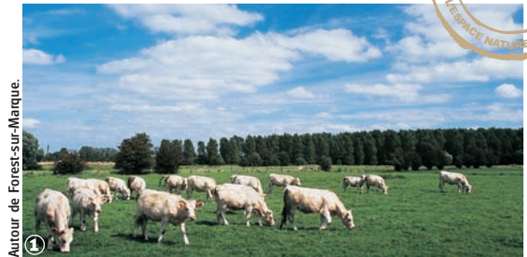
Autour de Forest-sur-Marque. ①

Randonnée Pédestre Boucle des Bonniers : 10 km