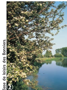
Base de loisirs des Bonniers. ②

Rédaction : Aline Ackx - Edition 2011 - Réalisation : Créathèmes Communication