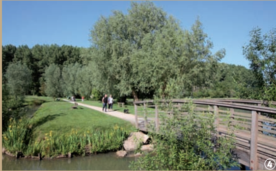
Base de Willems. ④