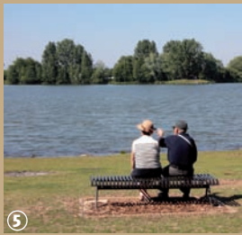
Lac du Héron. ⑤

ris, musaraignes et mulots. Quand l'hiver arrive, la quête de nourriture est plus difficile pour le héron ; il n'hésite pas alors à chercher réconfort dans une contrée lointaine. Mais tous les hérons ne migrent pas en hiver et malheur à celui ou celle qui voudrait s'accaparer son territoire, car la gourmandise et la possessivité sont ses deux plus grands défauts !