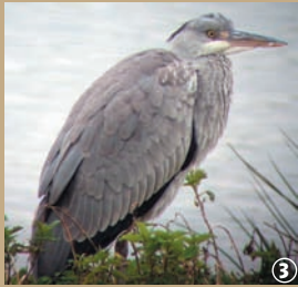
Héron cendré. ③

Cousin des cigognes, le héron cendré est facilement reconnaissable à son long cou, son bec long et pointu et ses hautes pattes ; son envergure